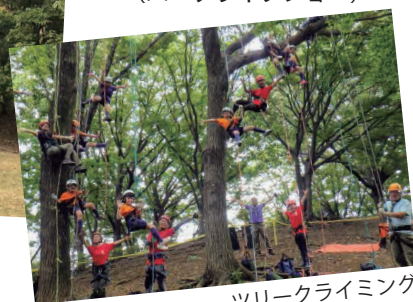
ツリークライミング