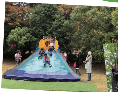
実験的に遊具を置いてみた